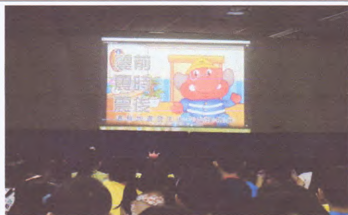
地點：地下一樓活動室 時間：108年9月6日 說明：說明地震三部曲