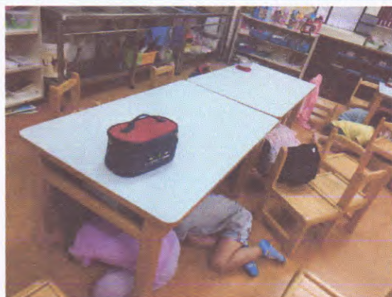
地點：教室 說明：趴下、掩護、穩住