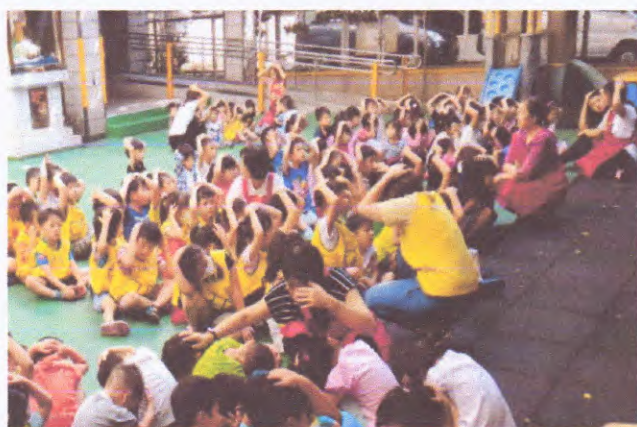
地點：廣場 說明：疏散至廣場集合點名