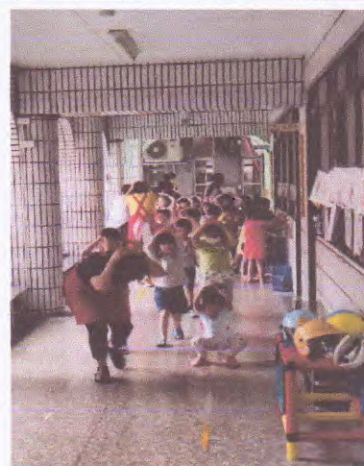
地點：走廊 說明：老師帶領小朋友離開教室